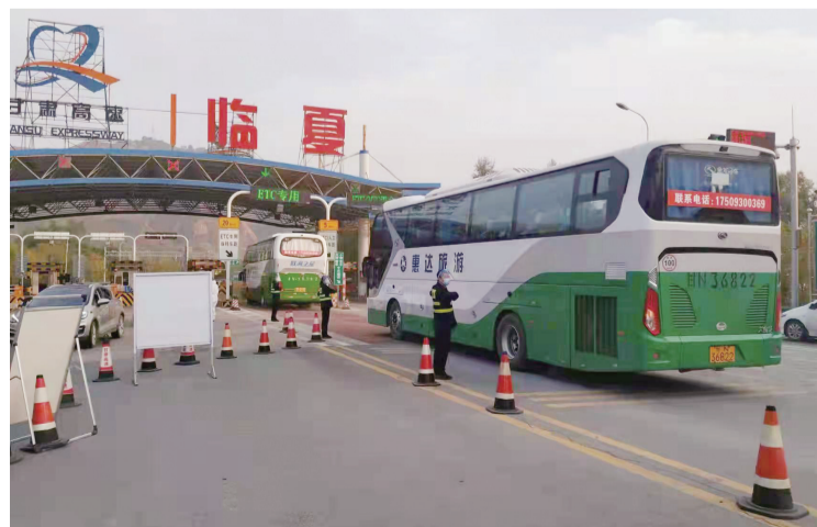
省交通检疫组保障第一批700名支援兰州医护人员安全顺利转运

10月24日1时34分,省交通检疫组接省疫情联防联控领导小组紧急通知,拟从临夏州和定西市调集700名医护人员驰援兰州,要求交通检疫组组织转运运力。接到通知后,省交通检疫组立即组织临夏州、定西市交通运输部门及省高速公路运营部门进行转运运力保障。临夏州、定西市分别承担300名、400名医护人员调集任务,省交通检疫组协调临夏州、定西市交通运输部门分别调集8辆、11辆转运车辆,集中出发,高速公路运营部门开通快速通道,引导车队驶入高速公路,支援医护人员顺利到达兰州。